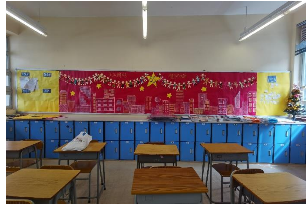
高中組壁報設計比賽冠軍：五信