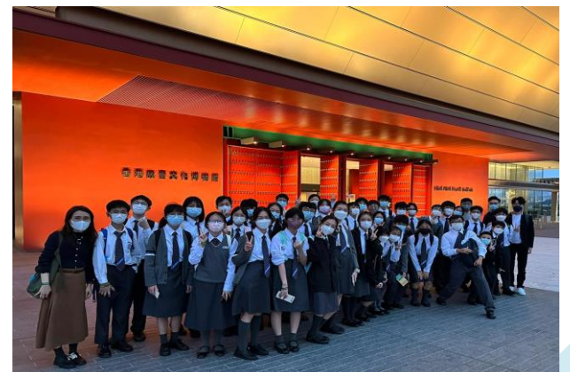
參觀香港故宮文化博物館