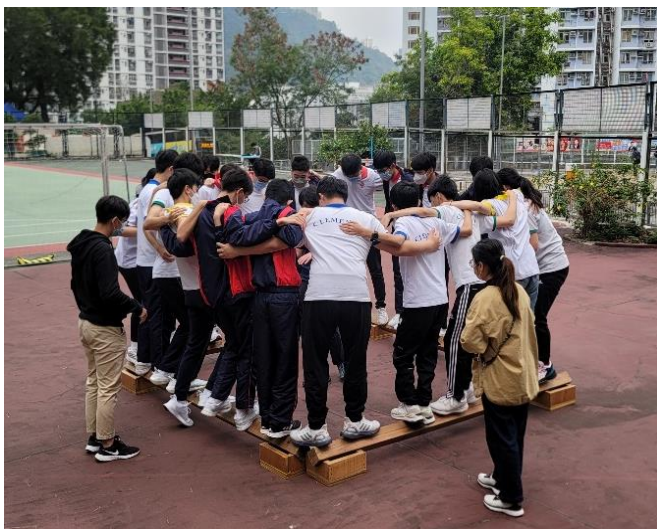
學生齊心協力挑戰歷奇活動