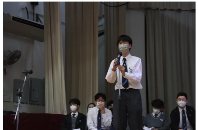
英語即席演講比賽