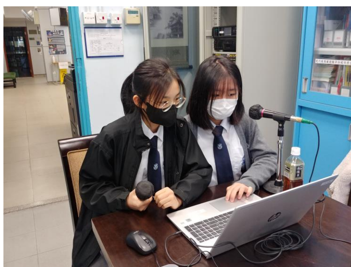
朋輩輔導員正擔任點唱站的主持