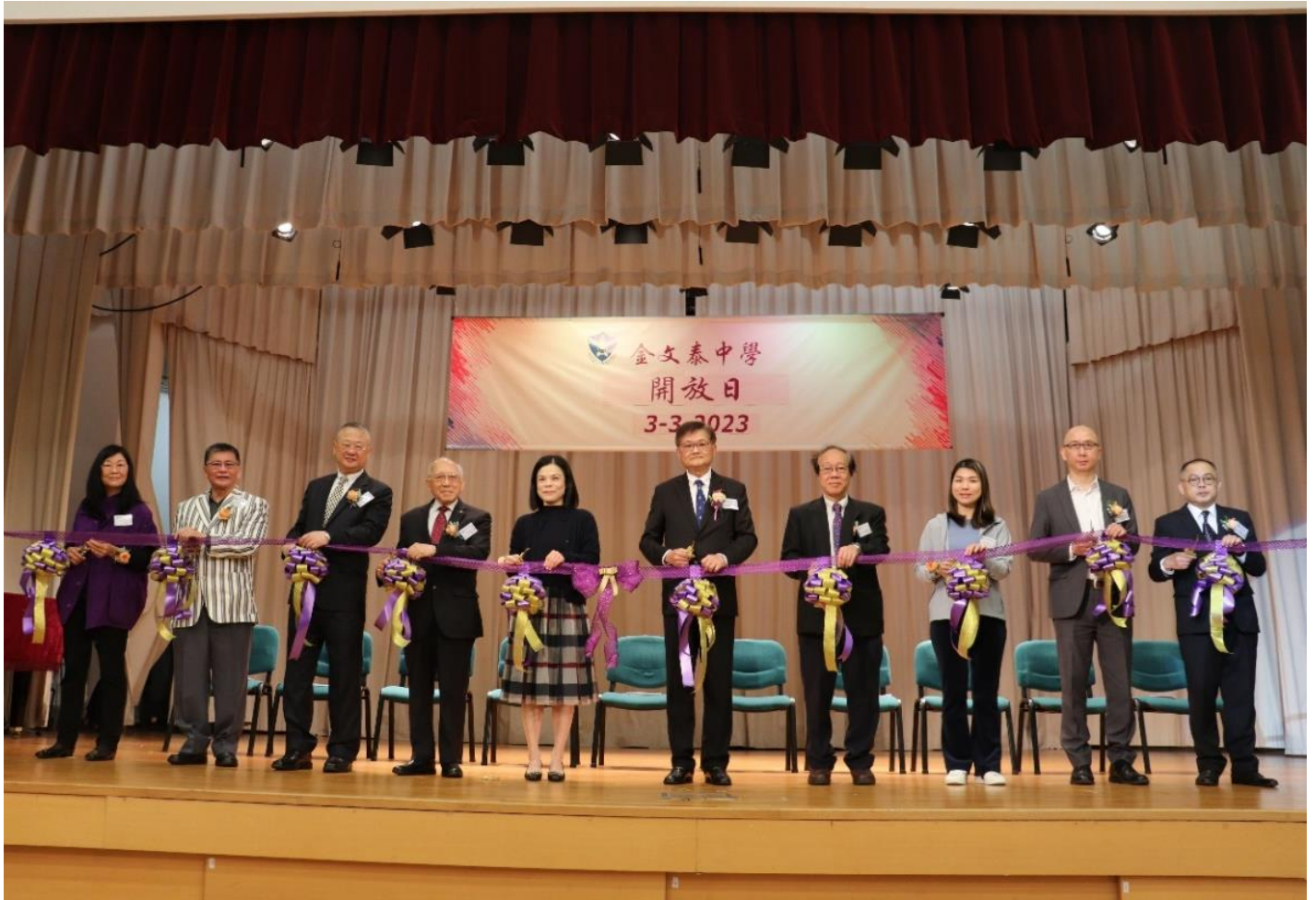
校長與嘉賓合照留念