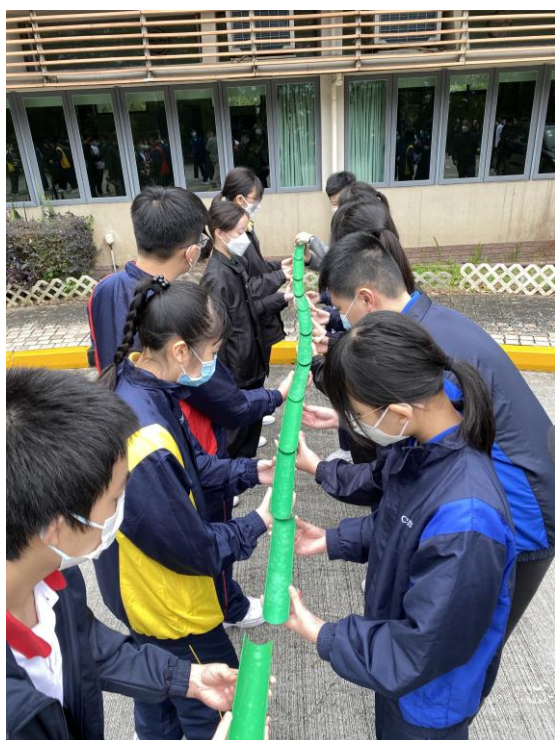
中二同學一同努力完成 成長挑戰營的任務

本校言語治療師除了為同學進行個別輔導訓練外，亦於 2 月 17 日及 2 月 24 日，分別為中三及中一級同學安排了專題言語訓練講座。講座內容按各級學生的學習需要，進行對應的訓練。中三級講座的主題是「香港人正音，你我都要識」，目的為協助學生提升其對正音的認識及改善懶音。中一級講座主題則是「社交達人速成班」，旨在讓學生認識和應用社交思維。