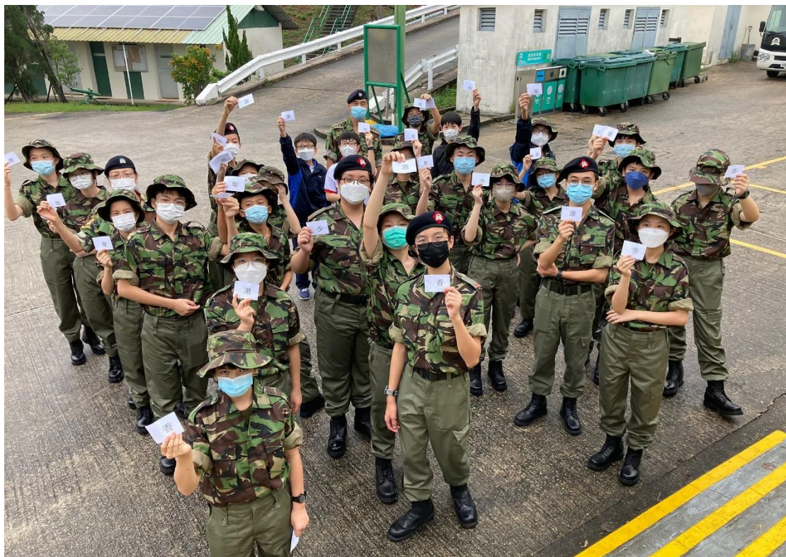
每月一次訓練日營

本團平日使用西貢萬宜訓練營作為每月一次的周末訓練基地，除步操訓練外，導師亦教授學員各項知識技能。