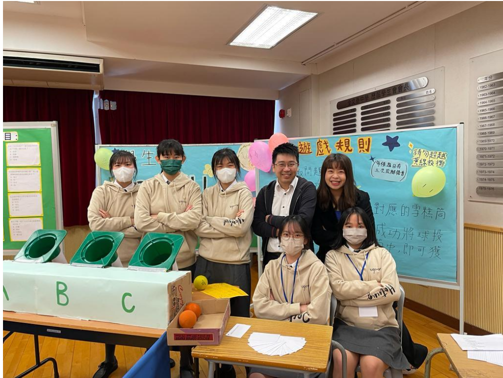
「IQ BALL 士」

本年度開放日已於3月3日順利舉行。本會悉心佈置「IQ BALL 士」攤位遊戲，當日幹事們用心地招待蒞臨本校參觀的來賓及同學，大家都盡興而歸。