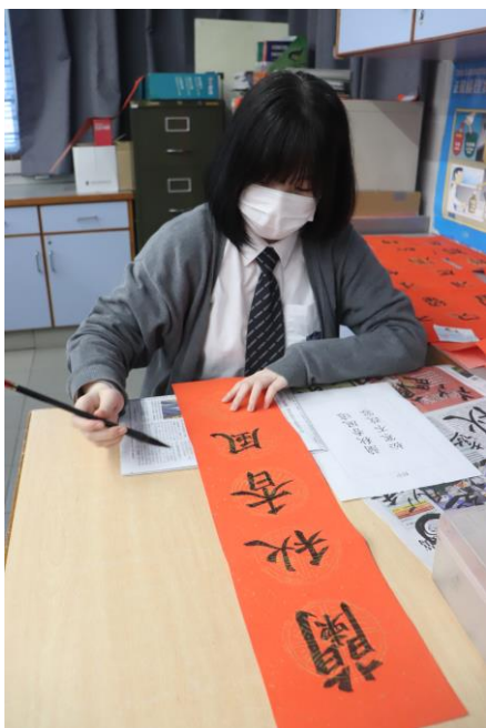
中文毛筆書法比賽