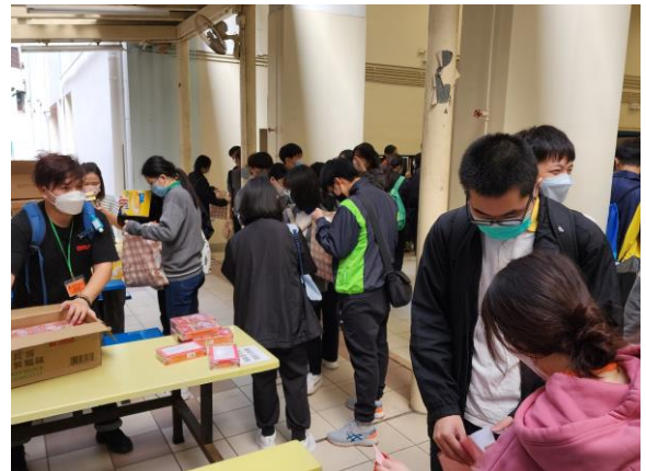
同學出發前整理物資