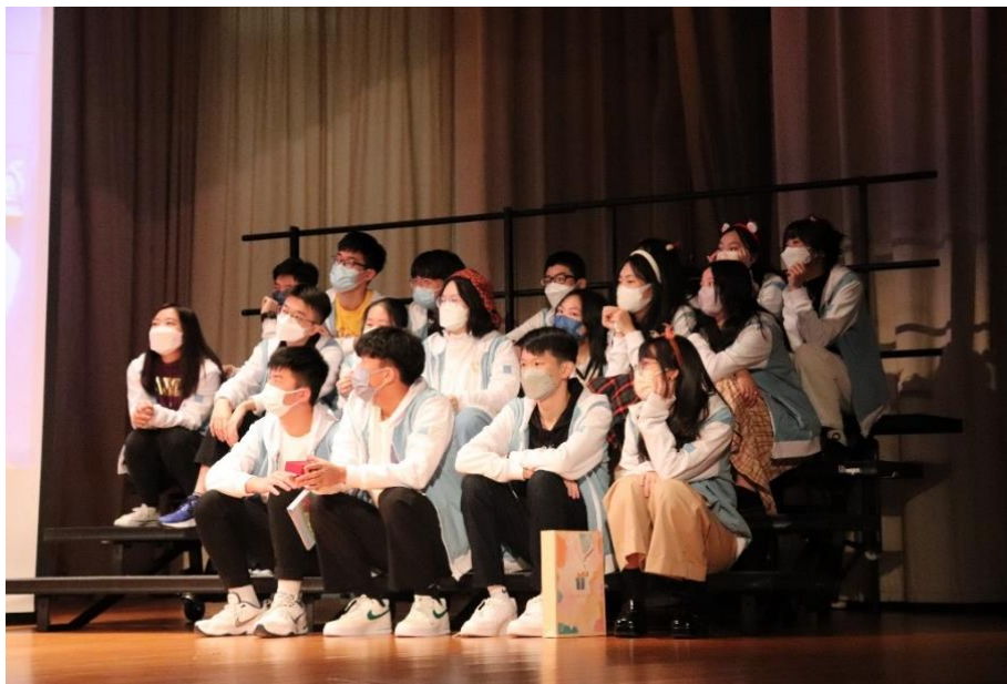
中六同學在台上播放班片

聖誕聯歡會已於 12 月 22 日順利舉行。當天除了有歌唱比賽、舞蹈比賽獲勝者的表演和抽獎環節外，中六級各班亦精心製作了班片與全校老師和同學分享。中六同學藉此機會表達老師的謝意，在台上送贈禮物予任教老師，場面溫馨動人。全校師生在聯歡會尾聲一同高唱聖誕歌，禮堂裏充滿節日氣氛，樂也融融。