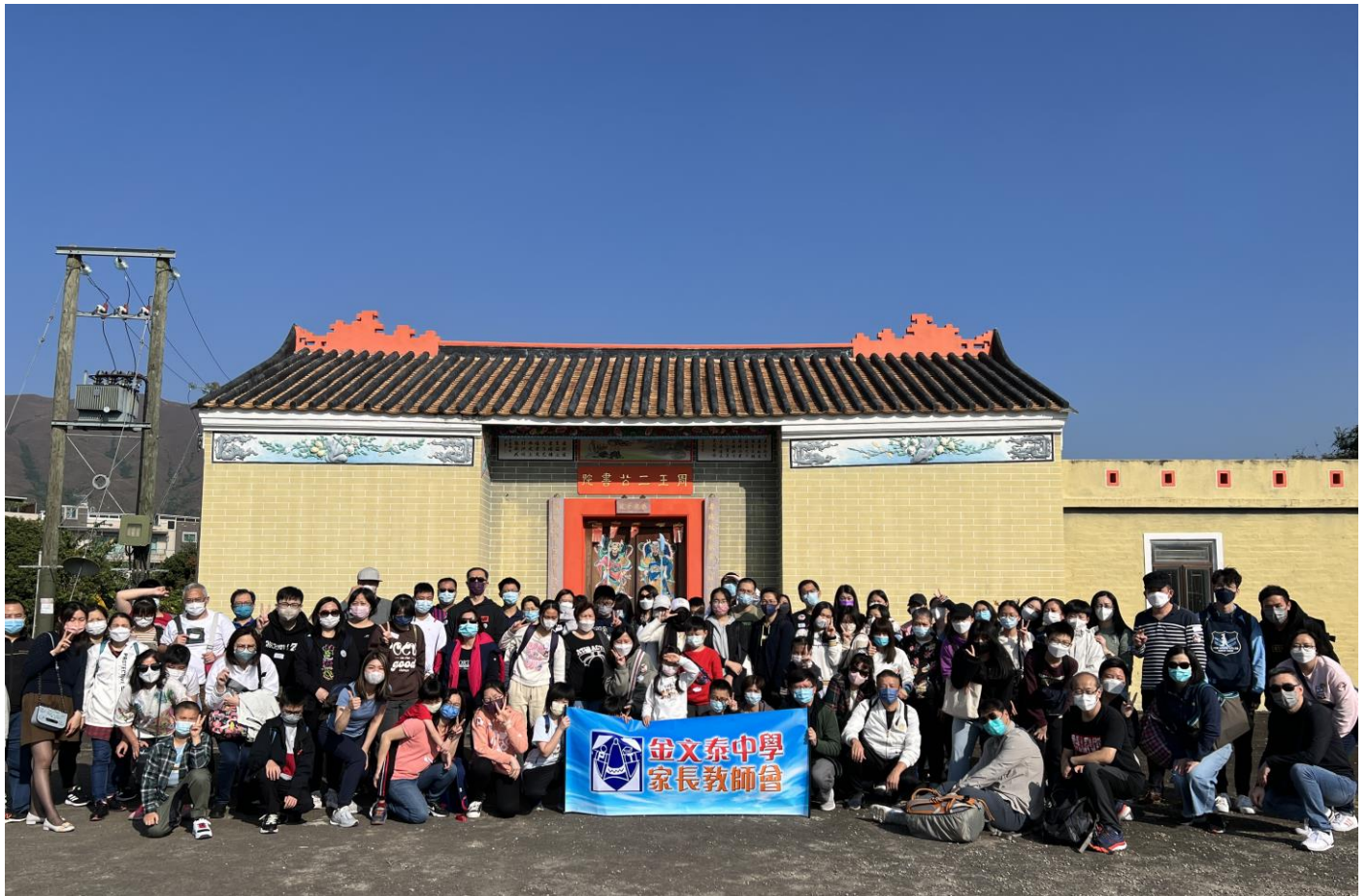
家長教師會親子戶外學習日

2023 年 3 月 3 日為學校開放日，家長教師會於有蓋操場設有攤位義賣禮品及限量精美小食作籌款。是次活動義賣禮品之收入為 5,671 元，而義賣食物在扣除成本後之收入為 2,485 元，總收入合共為 8,156 元，全數將撥入家長教師會獎助學金。