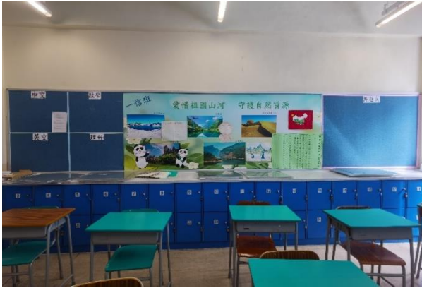
初中組壁報設計比賽冠軍：一信