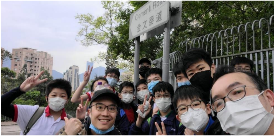
寶馬山至香港仔遠足

本校童軍亦於 2022 年 12 月 17 日舉行遠足活動，路線由北角寶馬山至香港仔，活動有 15 位成員參加。