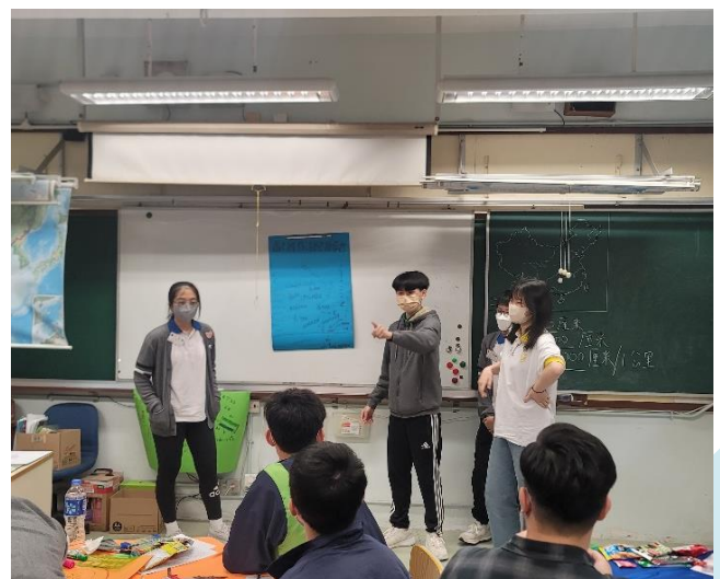
學生積極參與領袖培訓