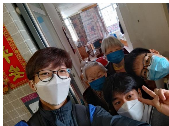
同學與探訪的長者合照