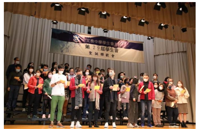
老師帶領全校同學們高唱聖誕歌