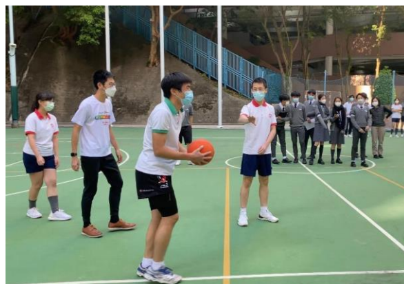
師生參與班際球類活動

中六級師生班際球類比賽於 11 月至 12 期間舉行。是次比賽不但能夠拉近師生之間的關係，更可以加強班內的凝聚力，而且為中六同學留下美好的回憶。經過激烈的初賽和決賽後，最終由六忠班奪得冠軍。