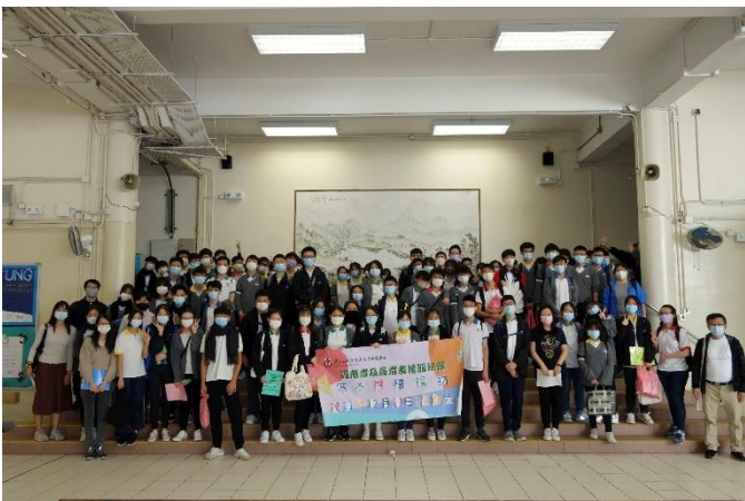
同學於出發前合照

本組與東華三院方樹泉長者地區中心合辦「寒冬送暖探訪活動」，讓學生可以透過社區義務工作，建立關心社區和服務他人的精神，秉承敬老的優良傳統，做到「老吾老，以及人之老」，以實際的行動表達對長者的關愛。活動承蒙東華三院方樹泉長者地區中心義工隊協助，為長者準備愛心禮物，再由同學親自於2021年12月11日出發探訪東區時送贈獨居長者。當日同學亦帶同由本校社會服務組及書法學會準備的揮春，為長者送上真摯的祝福和關懷。活動得以順利完成，實在有賴同學及老師的積極參與，期盼長者也能感受同學殷切的美意。透過是次探訪活動，同學表示學會多聆聽、多關懷身邊的人。