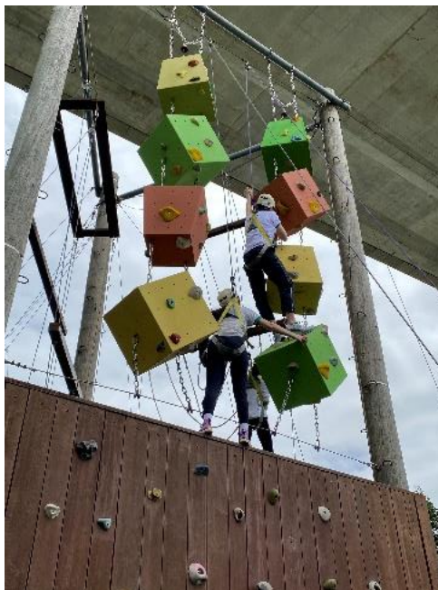
中五同學於突破自我挑戰營中努力完成任務

在增強學生的自信及鞏固學生面對逆境的正確態度方面，本校舉辦切合各級學生需要的成長活動，包括：中一級律己成長營、中二級個人歷奇挑戰營、中三級生涯規劃及團隊歷奇挑戰營、中四級抗逆減壓工作坊及中五級突破自我挑戰營，讓學生透過不同的學習經歷，擴闊視野，增強自信，以堅毅的精神，樂於承擔的態度面對成長的各種挑戰。惟受疫情的影響，上學期除了中一級律己成長活動順利於9月完成外，其餘級別之活動均延至下學期舉行。在特別假期後，中二級至中五級的成長活動已重新開展，並於5月至6月期間順利完成，同學們都積極參與，為疫情期間的學校生活添上色彩。