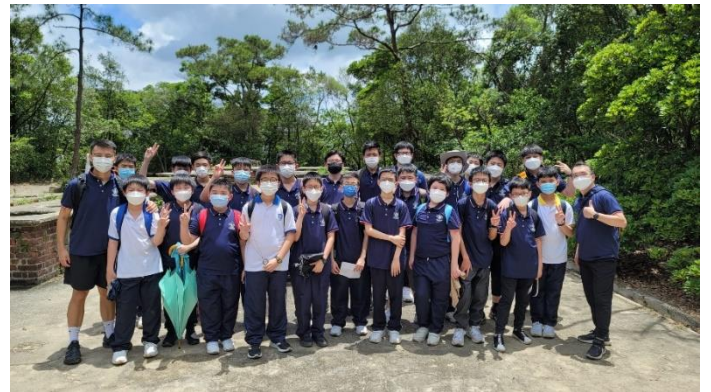
於鯽魚涌戰時爐灶前合照