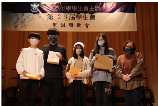
抽獎環節的幸運兒

聖誕聯歡會於12月21日順利舉行。當天除了有歌唱比賽、舞蹈比賽獲勝者的表演和抽獎環節外，還有播放中六同學精心製作的班片及送贈禮物予任教老師的環節。聯歡會尾聲，全校師生一同高唱聖誕歌，禮堂裏充滿節日氣氛，樂也融融。