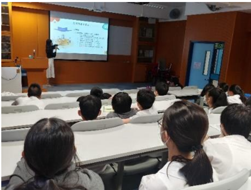
言語治療師主持專題言語訓練講座

本校言語治療師除了為同學進行個別輔導訓練外，亦於 5 月 20 日、6 月 10 日及 7 月 8 日，分別為中三、中二及中一同學安排了專題言語訓練講座。講座內容按各級學生的需要，進行相應的訓練。中三級是「閱讀理解策略」，目的為協助學生提升其閱讀理解能力。中二級是「香港人正音，你我都要識」，主要協助學生提升其對正音的認識及改善懶音。中一級是「社交達人速成班」，旨在讓學生認識和應用社交思維。整體而言，學生的反應良好，並表示活動有助他們改善言語及溝通的技巧。