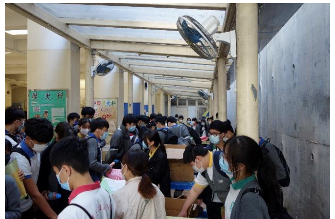
同學於學校操場幫忙分配物資