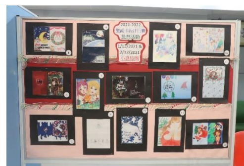
聖誕卡設計比賽投票