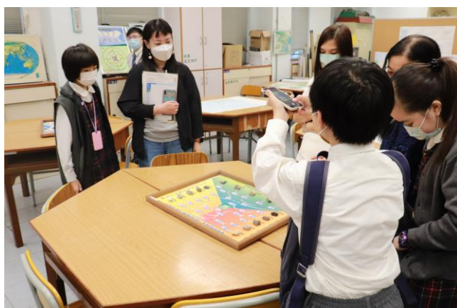
來賓自由參觀校舍