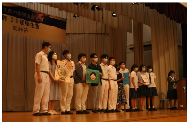
學生代表致送小小心意與班主任們

學生會於 9 月 10 日舉辦了一年一度的敬師日，旨在培養同學感恩之心，讓同學藉着敬師日向各位老師表達衷心的謝意，感謝老師一直以來盡心盡力教育同學，讓同學能在校園裡愉快學習。各班同學於當天向班主任致送精心設計的敬師卡，學生會代表更代表全體學生向校長、副校長以及所有非班主任老師致送心意。此外，家長代表亦鼎力支持是次敬師節日活動，齊來向老師致謝。