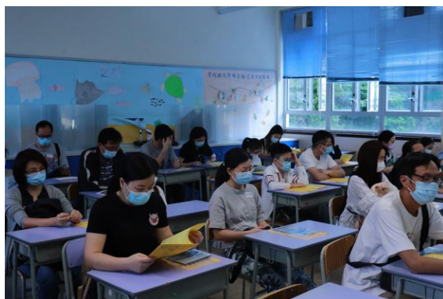
來賓在課室收看直播