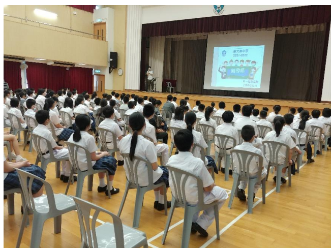
中一同學認真聆聽老師講解如適應新校園及心理轉變。