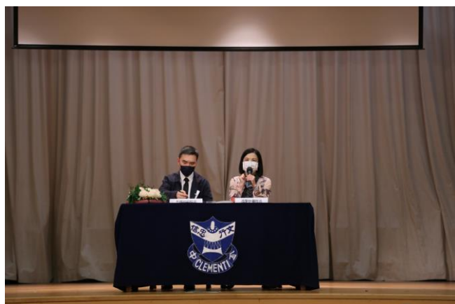
校長與副校長有條不紊地回應家長的提問