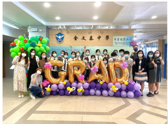
才藝培訓班學員合照