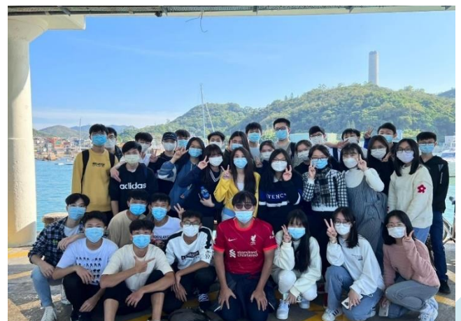
學生與班主任於碼頭合照

一年一度的秋季旅行已於 11 月 26 日順利完成，中二、中四、中五及中六級學生的旅行地點分別為元朗大棠度假村、長洲、南丫島及海洋公園。師生透過燒烤、野餐、集體遊戲等活動舒展身心、排解日常工作和學業的壓力，和樂融融。