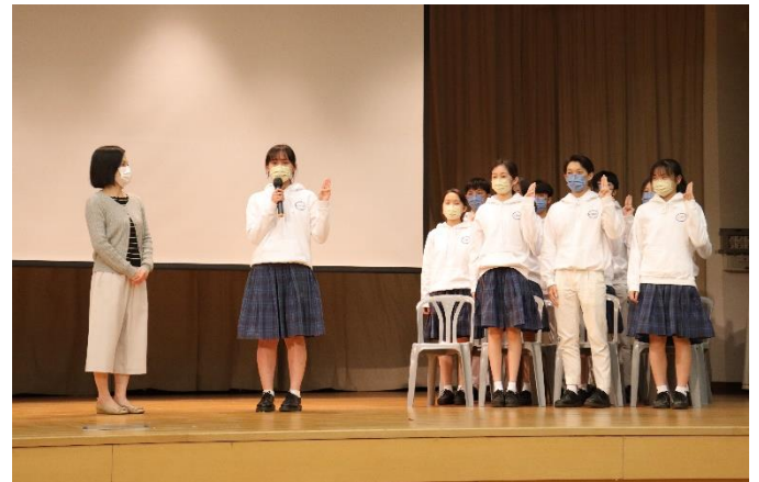
新任學生會 Meteor 的成員進行宣誓