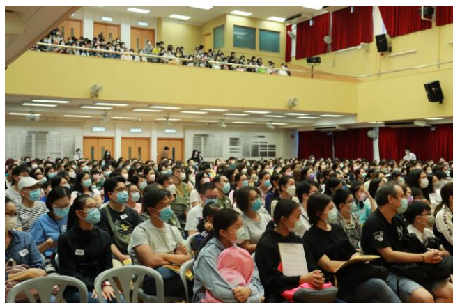
家長聚精會神地聆聽收生資訊

於資訊日發放的資料，有助家長進一步了解本校；有關資料亦已上載本校網頁，歡迎參閱。