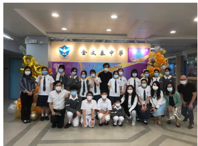
才藝培訓班學員合照