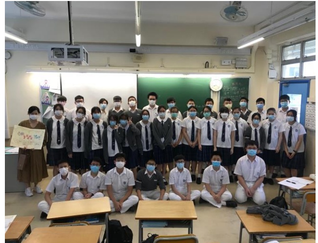
敬師日學生代表的大合照