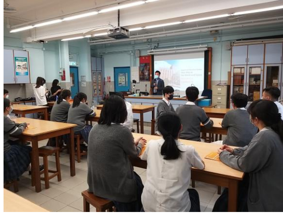
中六級香港理工大學工商管理學系到校講座

為使中六及中五同學了解一些熱門與工商管理有關的學系，本組特邀現就讀香港理工大學工商管理學系的校友及他們的導師於10月23日到校，為同學講解有關學系的入學條件、課程內容及就業前景。