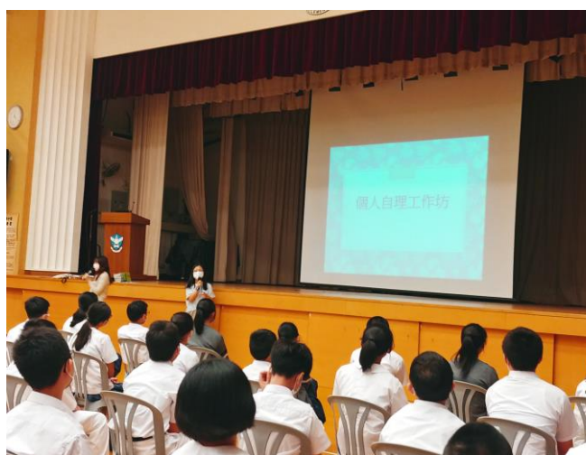
中一迎新活動中，社工為本校學生主持個人自理工作坊，讓學生了解如何處理自身的衛生問題。

為提升學生尊重別人的意識，以及認識如何與同輩相處的技巧。本組為中二級同學於11月9日及11月16日舉辦「同輩相處」工作坊。活動有助學生認識自己的優點和缺點，建立學生對兩性關係的正確價值觀，學習與異性朋友相處時應有的態度。