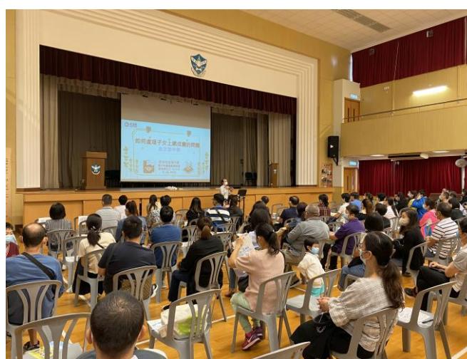
社工傳授秘笈協助家長如何處理子女網上成癮的問題，家長留心聽講。