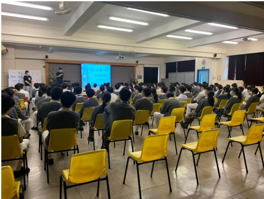
同學細心聆聽方樹泉中心社工講解探訪獨居長者詳情

此外，本組與書法學會合辦校內寫揮春工作坊。活動已於11月11日及11月12日的放學順利舉行。當日，本會的學生幹事及一眾會員一起即席揮毫，書寫揮春，為12月的獨居長者探訪活動送上溫暖及祝福。