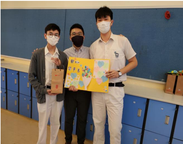
學生代表致送小小心意與班主任們

本校每年均會舉行「敬師日」活動，旨在培養同學感恩之心，讓同學把尊敬老師的心意化為行動，以此感謝老師一直以來盡心盡力教導同學，讓同學能在校園中愉快學習。因疫情的影響，今年的敬師日延至 10 月舉辦，雖未能讓全校師生齊聚於禮堂，但活動仍以不同方式進行：家長代表與學生會代表於 10 月 9 日一同代表全體同學及家長，向校長致送紀念品；學生會成員和各班同學亦分別在 10 月 12 日早上點名時段，向非班主任老師及班主任送上精心設計的敬師卡及紀念品。