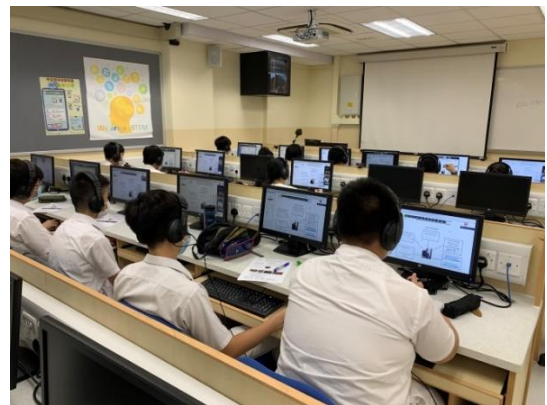
學生專心投入網上學習活動