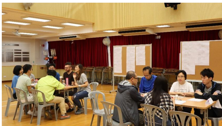
老師認真討論關注事項。

下午時段，全校老師參觀位於香港屯門曾咀的【源·區】T·PARK。【源·區】T·PARK為香港首個自給自足的污泥處理設施，藉着這次參觀，不但讓大家見證香港於落實「轉廢為能」的成績，更帶出環保的訊息，鼓勵大家一起加強環保行動，共同應對氣候變化，深化節能減廢及打造低碳的香港。