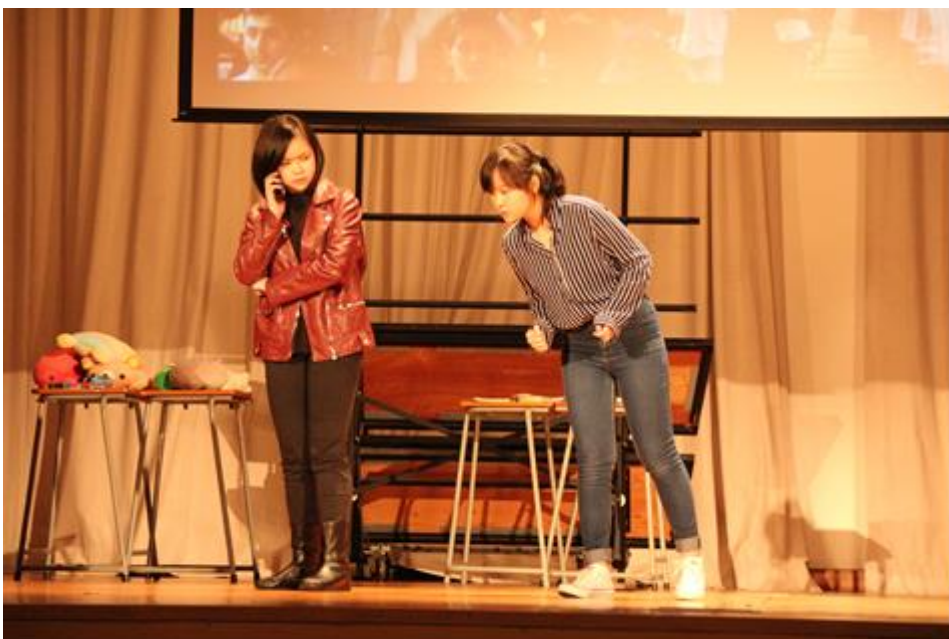
同學用心演出，演繹了母女的衝突。