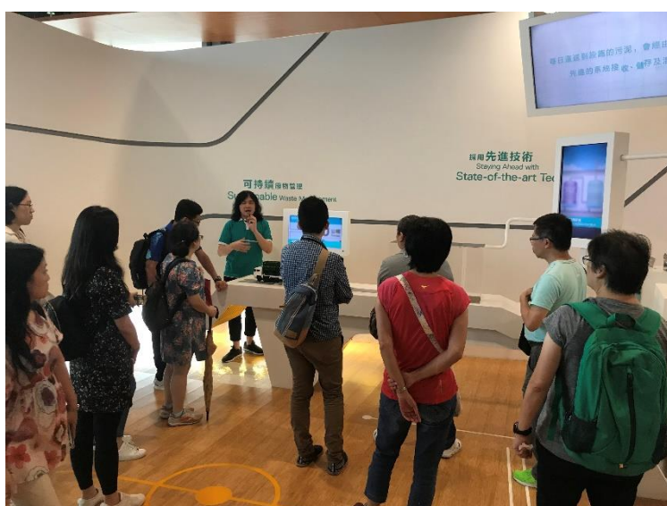
老師聆聽導賞員介紹源區的運作。