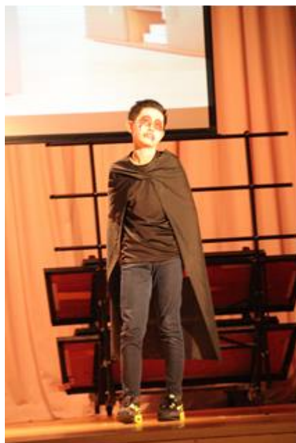
吸血殭屍的造型維肖維妙。

本校話劇組參加了於4月24日舉行的第二屆官立中學聯校話劇節，表現優異，獲多個獎項(詳情可參考校外獲獎紀錄)，並獲邀參加於7月4日在沙田官立中學舉辦的頒獎典禮。