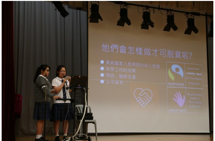
今年「貧富宴」的主題是「貧窮飢餓源於不公平」。

「貧富宴」主要宣揚人人「生而平等」的信息，提醒同學每個人都有改變自己生活的能力，亦應被賦予此權利。希望參加的同學也能學會珍惜所有，活在當下。