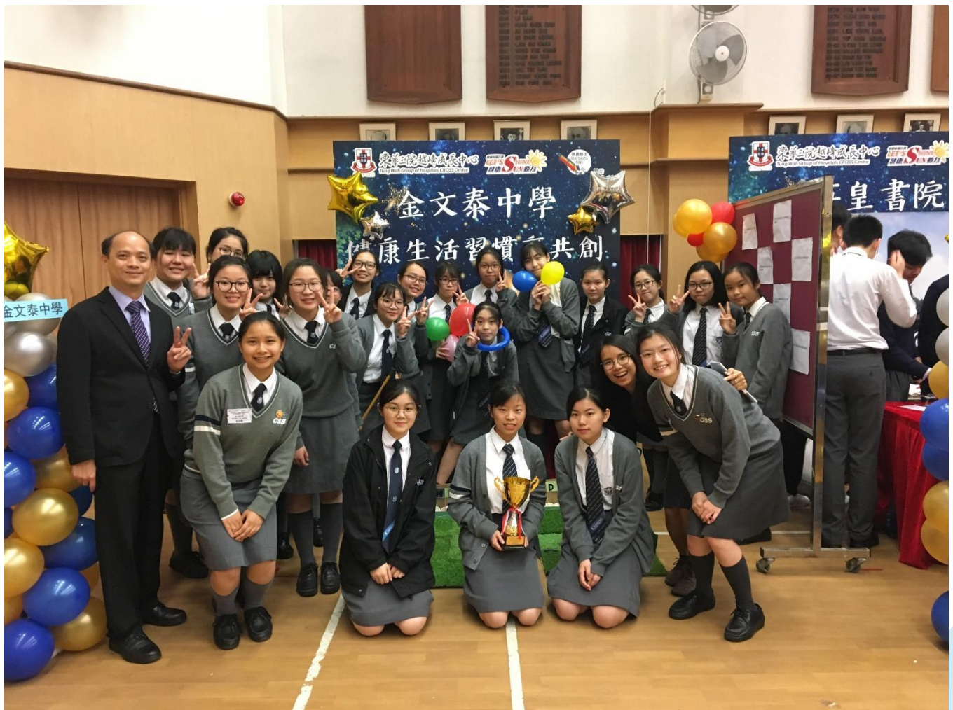
我校健康校園大使設計的攤位「健康生活習慣齊共創」奪得「最受歡迎攤位」獎項。

健康校園大使於3月23日參加港島區及離島區聯校嘉許禮攤位設計比賽，經過兩個多月的籌備，同學設計精美的攤位「健康生活習慣齊共創」奪得「最受歡迎攤位」獎項，實在令人鼓舞。