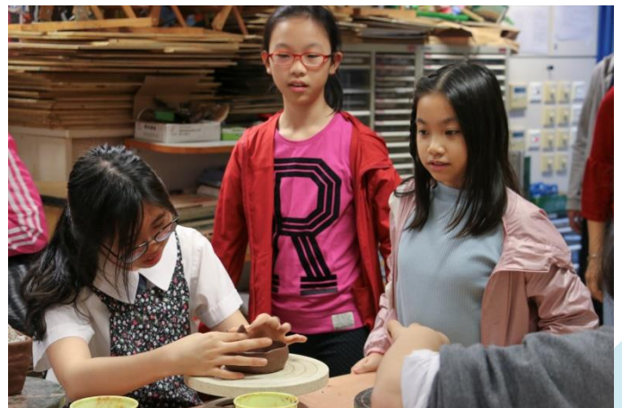
來賓參觀學生的示範活動。