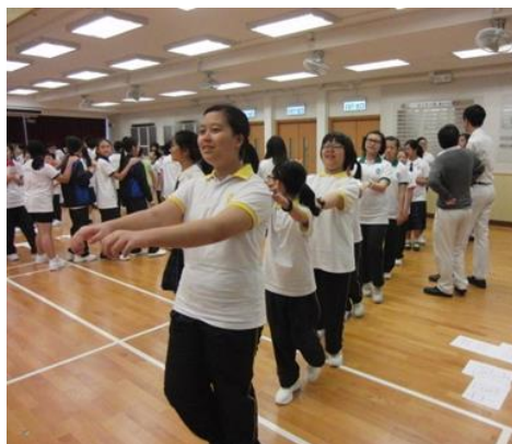
中一同學正參與中一迎新日的朋輩輔導活動。

為了讓中一學生能盡早適應中學生生活，本組於8月23日舉行中一迎新輔導活動。當日，首先由輔導主任向中一新生講解升讀中一注意的事項，例如怎樣適應新校園生活及在心理上如何作出調整。其後朋輩輔導員安排了一項集體遊戲活動，讓中一新生可以彼此認識，逐步建立良好的朋輩關係。另外，本組亦邀請了音樂老師在當日為中一新生作樂器介紹。此外，本組於8月28日舉辦中一家長日，由輔導主任向中一新生及家長介紹本校輔導工作。