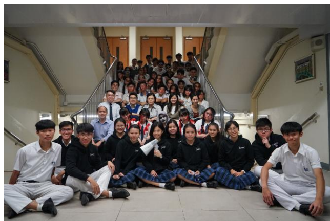
鬼屋活動圓滿結束。