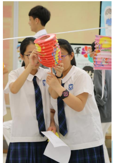
同學們，你猜到謎底了嗎？

學生會於10月4日中秋節當天舉辦了猜燈謎活動，與全校師生歡度佳節。活動反應熱烈，同學們在小息及午膳時間均踴躍參與活動，為校園添了不少節日氣氛。