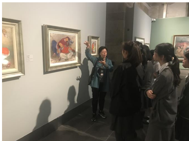
同學留心聆聽導賞員講解每件作品。