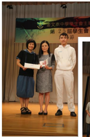
Omen主席及家教會代表致送禮物予校長。