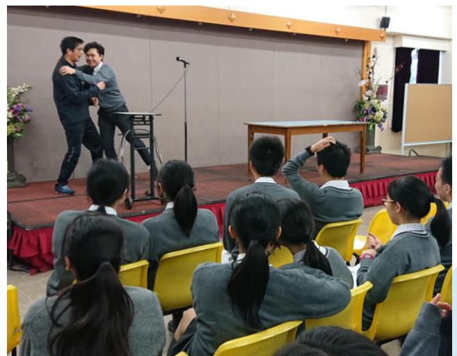
在「自衛術講座」中，講者向學生示範街頭襲擊的基本應付方法。

本組於2018年11月26日(星期一)為中六學生舉辦「自衛術講座」，讓學生明白保護自己的重要性及基本技巧。講者除帶領同學進行基本熱身拉筋動作及教授直拳、擺拳、上勾拳外，還示範街頭襲擊如熊抱、箍頸、扯頭髮、扯衫、打劫等等的基本應付方法。學生於是次講座表現積極投入。