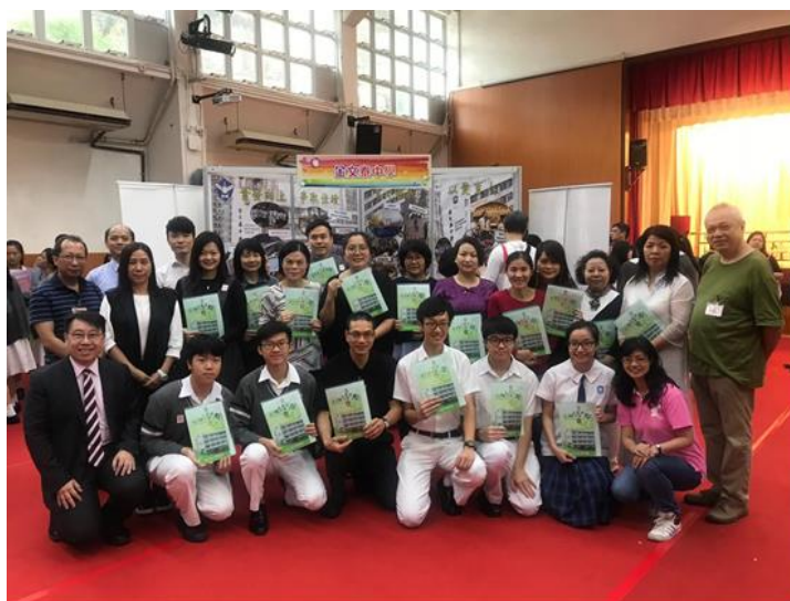
本年度的「東區升中選校巡禮」得到校長、副校長、家長義工以及一眾師生的鼎力支持，樂也融融。

本年度的「東區升中選校巡禮」已於11月17日(星期六)在勵志會梁李秀娛紀念小學順利舉行，本校亦獲邀參與其中，擺設攤位，校長、兩位副校長，連同師生，以及家長義工向在場的公眾人士及小六家長介紹本校的課程、學校特色及辦學宗旨等，氣氛熱烈。