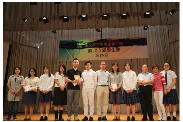
Omen幹事及家教會代表致送禮物予老師。