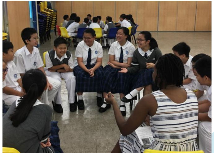
同學參與英文閱讀工作坊，表現投入。

英文科與“Typhoon Club”合作於10月15日至10月20日(一共6天)為五班初中學生舉行英文閱讀工作坊，以鼓勵同學閱讀，培養他們的閱讀習慣。在經驗豐富的導師指導下，同學都能踴躍地參與各種閱讀活動。