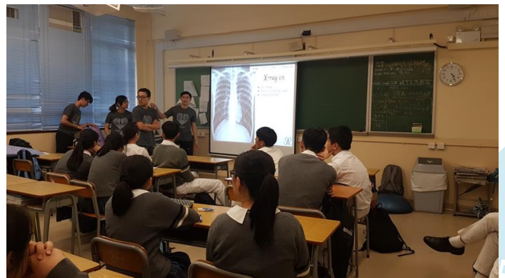
香港理工大學物理治療及放射治療學系到校講座。

為使中五及中六同學了解一些與醫療服務有關的熱門學系，本組特邀現就讀香港理工大學物理治療及放射治療學系的校友及他們的導師到校，為同學講解有關學系的入學條件、課程內容及就業前景。