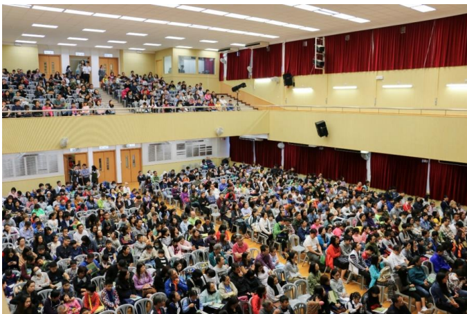
活動在熱烈的氣氛下順利完成。