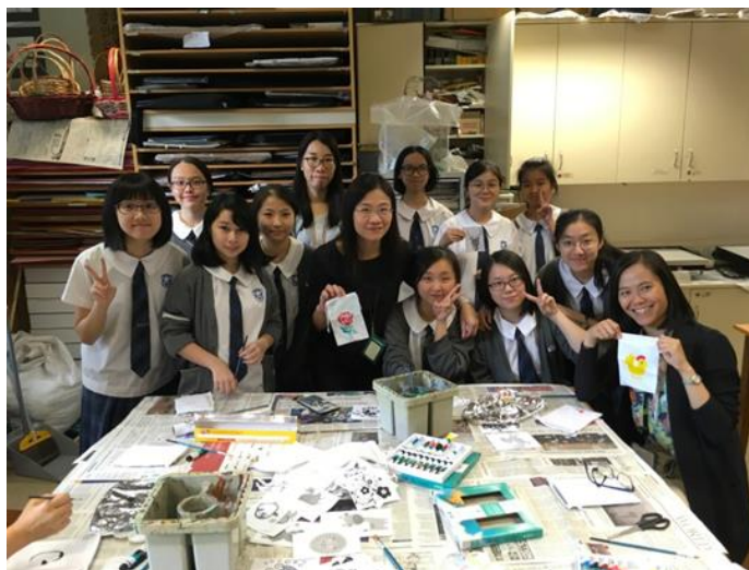
社會服務組會員努力為小布袋添上色彩。