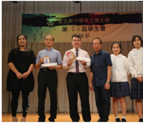
Omen幹事及家教會代表致送禮物予副校長。