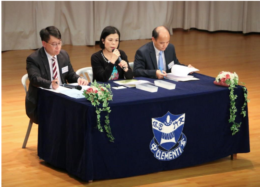
校長及兩位副校長細心解答來賓的疑問。