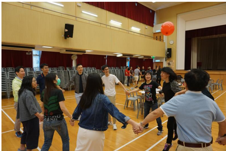
老師們積極投入遊戲中。