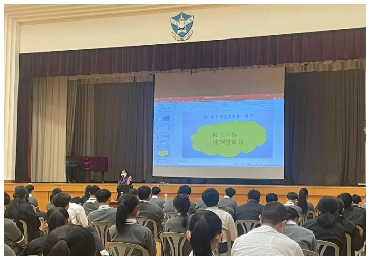
高中選科原則及方法講座

中一級於3月25日進行了摘錄筆記工作坊，當天每班均由一位專業導師，教導同學在不同科目中可使用的摘錄筆記方法。透過工作坊，學生認識自己的學習模式類型，並提升自己的學習效能。