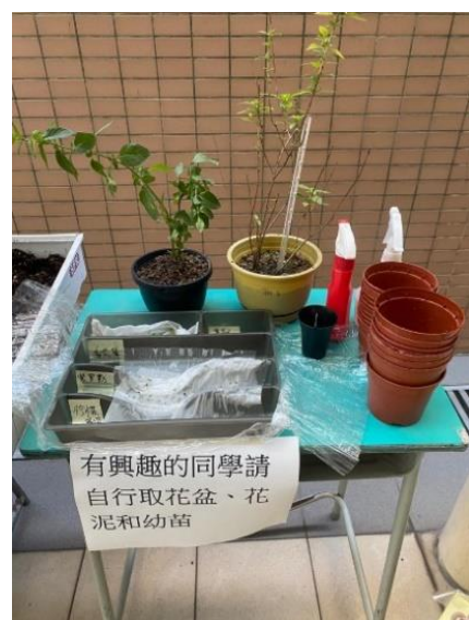
擺放種植物資的攤位