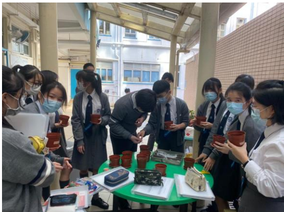
同學正在選擇香草種子

環保大使於校內種植不同類型的香草，包括薄荷、檸檬薄荷和羅勒等。學生從栽種香草過程中，學習糧食種植的過程及有機種植的概念。