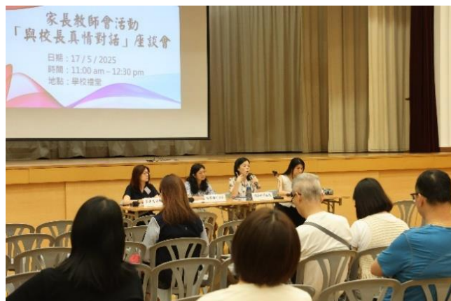
校長細心解答來賓的疑問

為了加強學校與家長的溝通，讓家長更進一步了解學校的發展路向及子女的學習情況，本會於 2025 年 5 月 17 日（星期六）上午 11 時至 12 時 30 分，在學校禮堂舉行「與校長真情對話」座談會，校長親自為家長解答疑難。當天有多位家長出席活動，討論氣氛融洽。