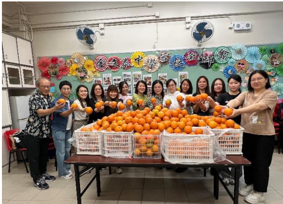
家長義工熱心幫助

衛生署自 2007 年起聯同多個機構，每年為學界舉辦「開心『果』日」活動，作為「健康飲食在校園」運動的其中一個重要環節。為配合衛生署舉辦的「開心『果』日」，本會於 2025 年 5 月 28 日（星期三）購買及協助分發鮮橙予全校師生享用，讓大家一起參與全年的水果推廣活動，藉此增加學生進食水果的興趣，長遠有助促進學生身體健康。每位同學在享用水果之時，也需用心完成一張心意卡，寫下進食水果的好處和感謝身邊人的照顧愛護。