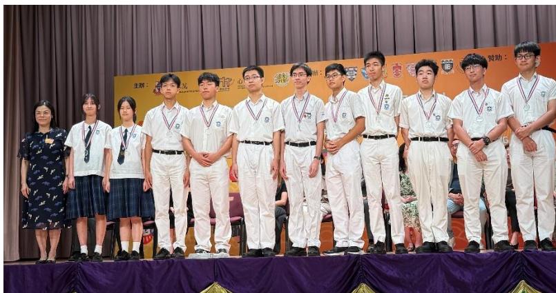
馮校長與一眾表現傑出的健康校園大使合照留影