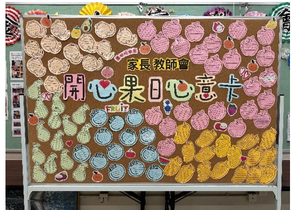
同學的感謝心意卡