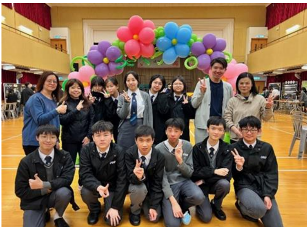
校長、老師及學生在氣球裝置前留影