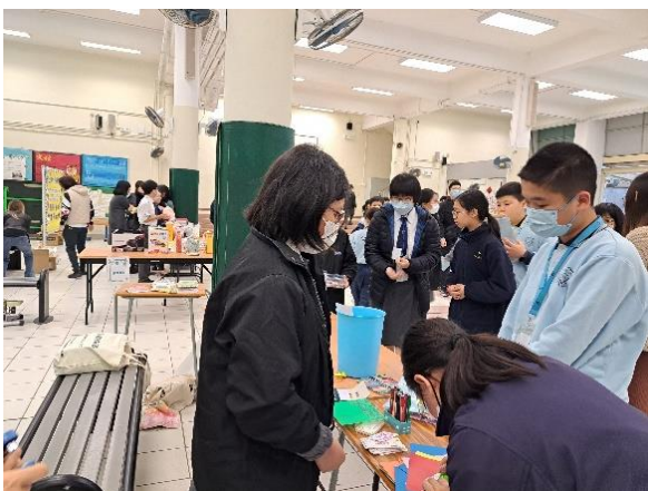
小學生踴躍參加開放日攤位

本校的朋輩輔導員在3月課後為有需要的同學提供功課輔導，旨在提升學生的學習興趣和對學校的歸屬感，從而增強學生的自信心和團體合作精神。