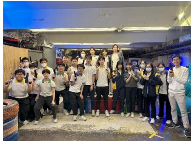
設計活動後老師與同學合照留念