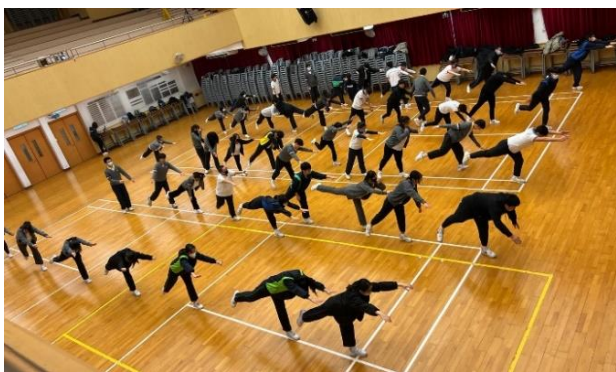
中四級同學於禮堂進行伸展運動

為了讓學生舒緩壓力，培養定期運動的習慣，以及建立健康的生活方式，本組於 2024 年 1 月 23 日為中四級同學舉辦了彈力帶運動和伸展運動工作坊。是次工作坊包括理論及實踐兩部分。透過導師講解及學生即時的實踐，學生能夠認識和學習不同的伸展動作，以及使用彈力帶進行強化伸展，鼓勵學生在家中也能透過簡易的工具舒展身心，並培養定期運動的習慣。