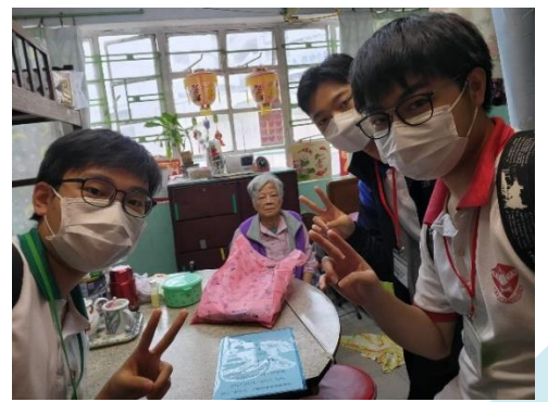
同學與長者的合照