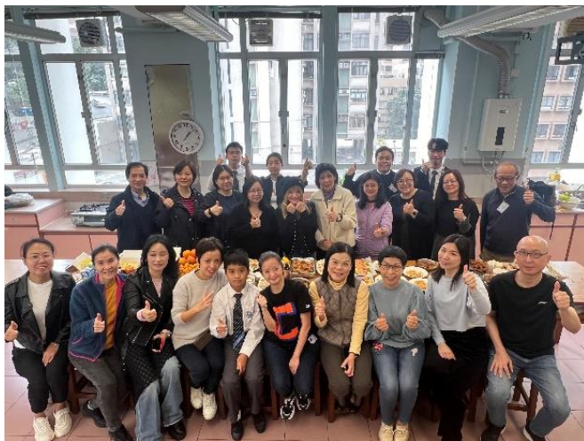
家長義工與老師大合照

為加強家長義工之間的彼此聯繫，本會於 2024 年 2 月 25 日中午在家政室舉行「家長義工新春團拜」。各家長義工預備不同的賀年食品，一同品嚐美食及分享製作心得，共度快樂的中午。