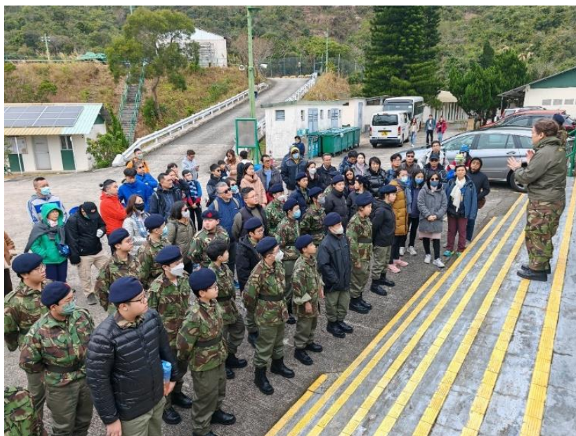
「S 中隊開心家庭同樂日」家長到臨訓練基地參觀

另外，為了讓家長能進一步了解子女的訓練情況和基地的設施，本團已於 2024 年 1 月 28 日假西貢訓練營舉辦「S 中隊開心家庭同樂日」，邀請家長到臨參觀。