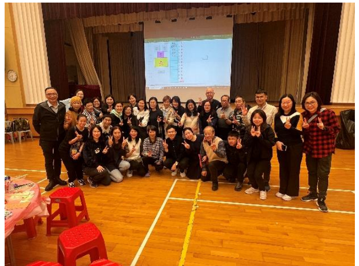
家長與老師大合照