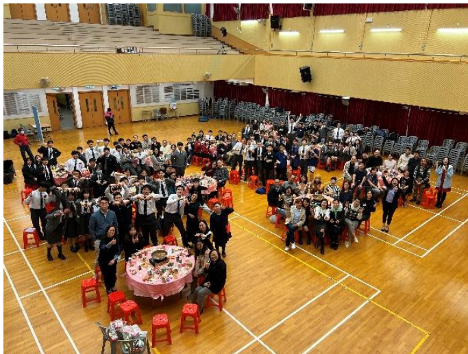
一同享用特色盤菜

為了加強家長間的聯繫，本會於3月8日晚上7時至9時，假學校禮堂舉行新春周年盆菜晚宴，席間設有抽獎節目助慶。當晚筵開11席，報名總人數達138人。大家除了圍坐一起享用富有新界圍村特色的盆菜宴外，家長與老師也投入地交流溝通，晚宴在大家的歡聲笑語中圓滿結束。