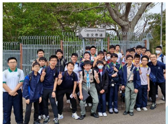
童軍專心聆聽導師講解清潔行山徑義工活動的注意事項