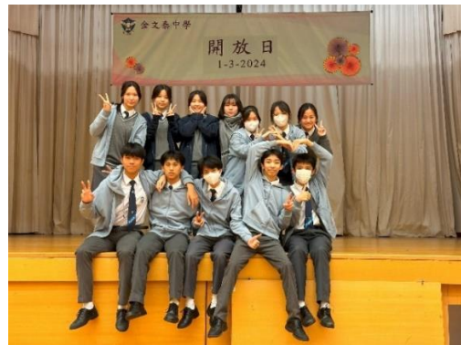
開放日圓滿結束後合照