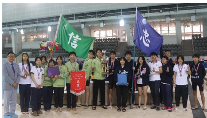
社際啦啦隊雙冠軍——忠社及信社