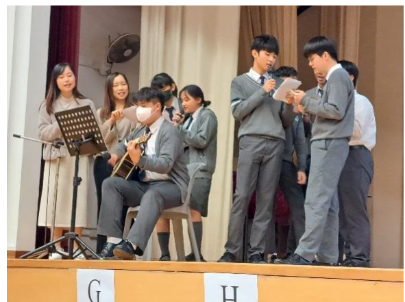
社工和中六級同學在 SOS 情緒急救工作坊中帶領台下同學大合唱