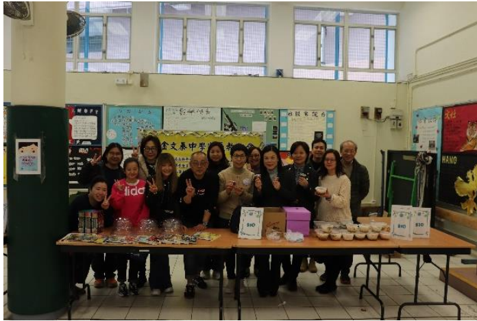
家長教師會義賣籌款攤位

2024年3月1日為學校開放日，家長教師會於有蓋操場設有義賣籌款攤位及限量發售精美小食。是次開放日家長教師會攤位義賣禮品之收入為$5,630.9。而義賣食物在扣除成本後，收入為$4590.5。綜合是次活動禮品義賣及食物義賣之總收入為$10,221.4，全數將撥入家長教師會獎助學金。