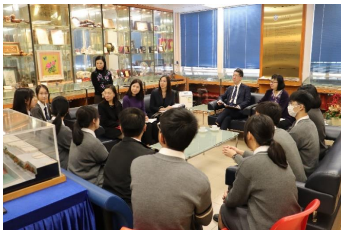
常任秘書長與學生於校史館內交流暢談

教育局常任秘書長李美嫦女士於 2024 年 2 月 21 日到訪本校，當天由學生代表帶領參觀校舍，並與各級學生代表、家長教師會家長代表及教師代表會面，與學校不同持分者交流。