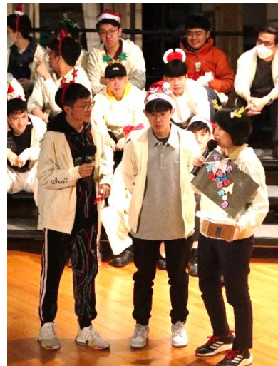
班代表送贈禮物予任教老師