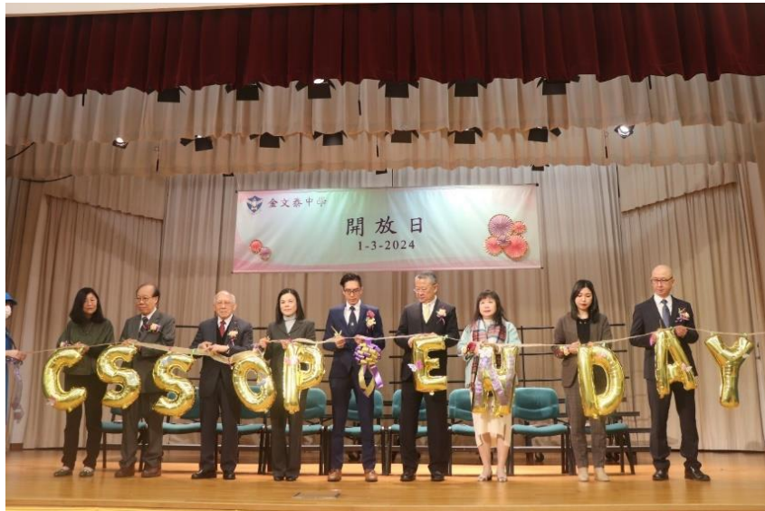
校長與嘉賓進行剪綵儀式

當天在禮堂和兩天操場共設有 19 個攤位，放置展板，以及富創意的攤位遊戲。活動除了展示學生的學習成果以外，亦顯示了同學、老師和家長對學校的支持和愛護。校友會和家長教師會也到來支持，擺設攤位。當天除了不少校友和家長光臨指導，活動亦吸引了本區鄰近小學近百多位小學生、老師和家長到本校參觀，讓公眾可以加深對本校的認識。