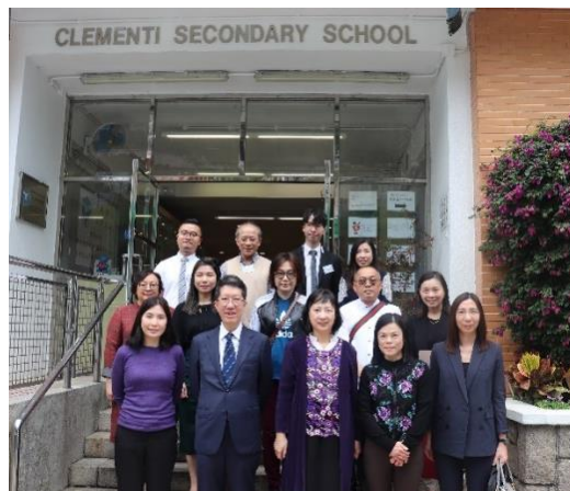
來賓與家長及教師代表合照