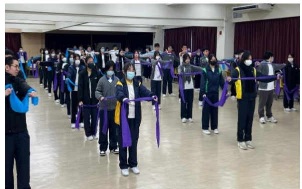
中四級同學於綜合活動中心學習彈力帶運動