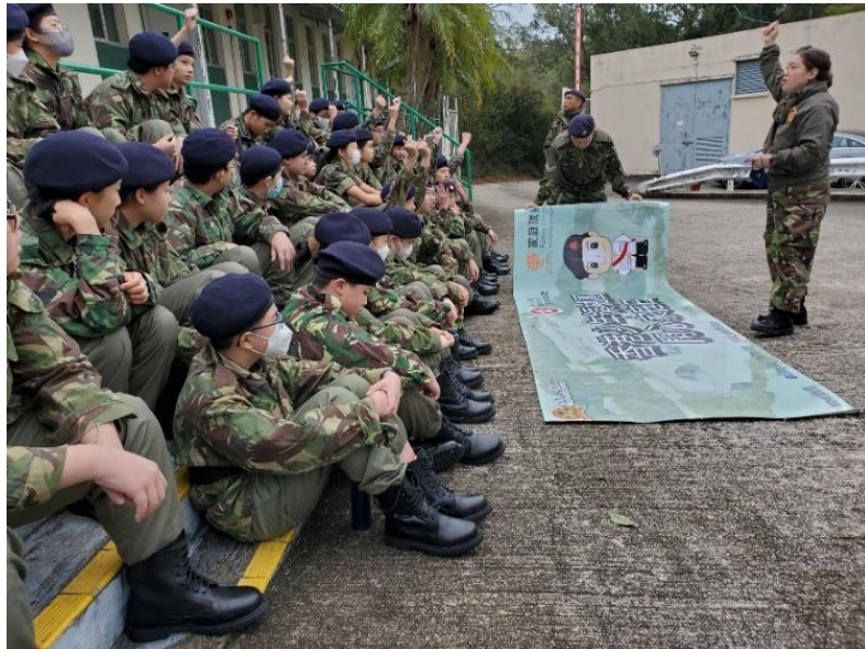
香港少年領袖團訓練營

本團平日使用西貢萬宜訓練營作為每月一次的周末訓練基地，除步操訓練外，導師亦教授學員各項知識技能。學員分別於 2023 年 12 月 3 日、2024 年 1 月 27 日及 2024 年 2 月 18 日進行有關訓練。