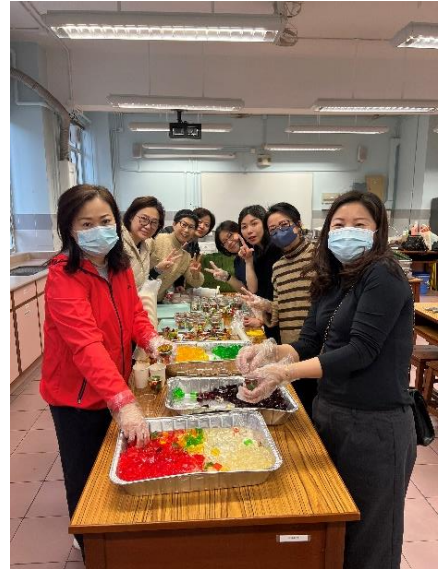
會員一起烹飪美味小食